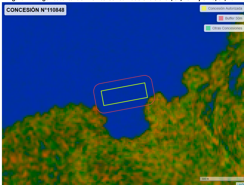
Figura 2. Imagen satelital del monitoreo realizado entre el 01/01/2024 y el 29/02/2024

En las siguientes figuras se muestran las imágenes analizadas para cada periodo y/o fecha: