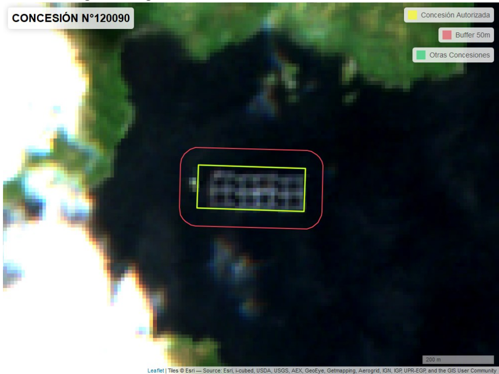
Figura 2. Imagen satelital del monitoreo realizado el 11/01/2024

En las siguientes figuras se muestran las imágenes analizadas para cada periodo y/o fecha: