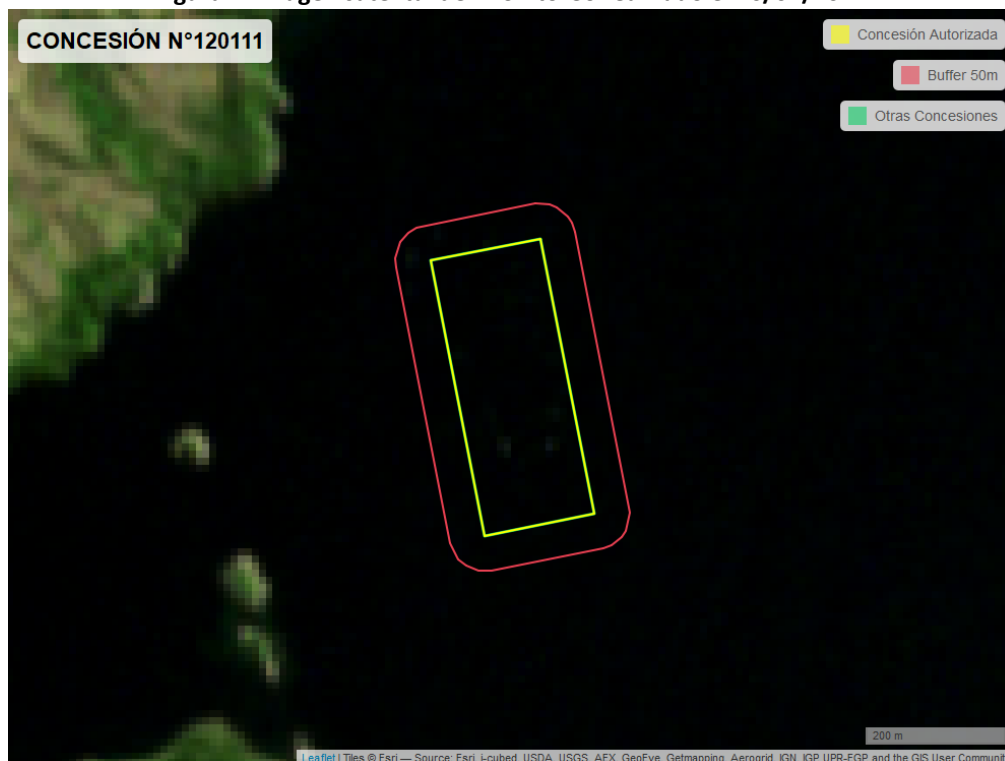
Figura 2. Imagen satelital del monitoreo realizado el 26/02/2024

En las siguientes figuras se muestran las imágenes analizadas para cada periodo y/o fecha: