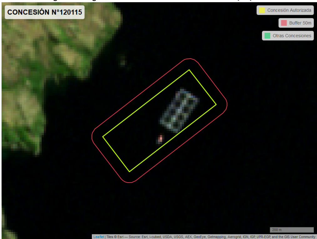
Figura 2. Imagen satelital del monitoreo realizado el 26/02/2024

En las siguientes figuras se muestran las imágenes analizadas para cada periodo y/o fecha: