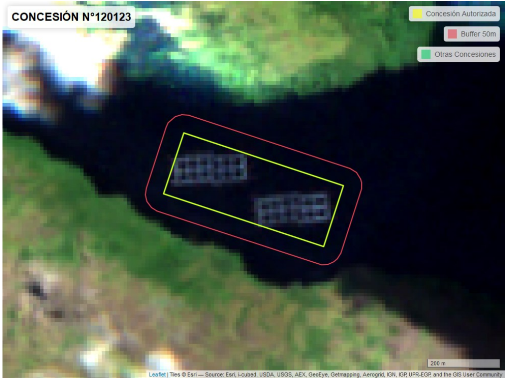
Figura 2. Imagen satelital del monitoreo realizado el 15/02/2024

En las siguientes figuras se muestran las imágenes analizadas para cada periodo y/o fecha: