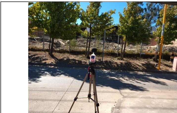
Fotografía 1. Registro de la medición de fecha 28-01-2025.