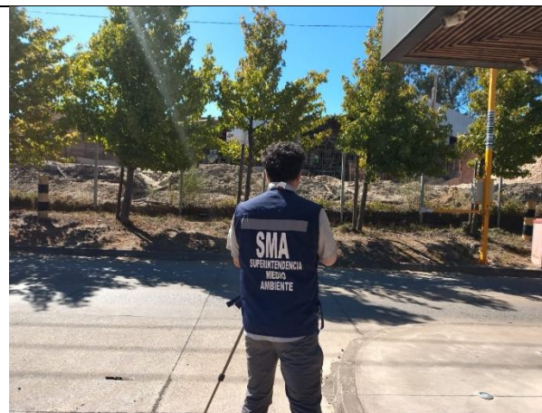
Fotografía 2. Registro de la medición de fecha 28-01-2025.