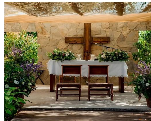
Imagen N°4: Capilla en Fundo Casa Pangui