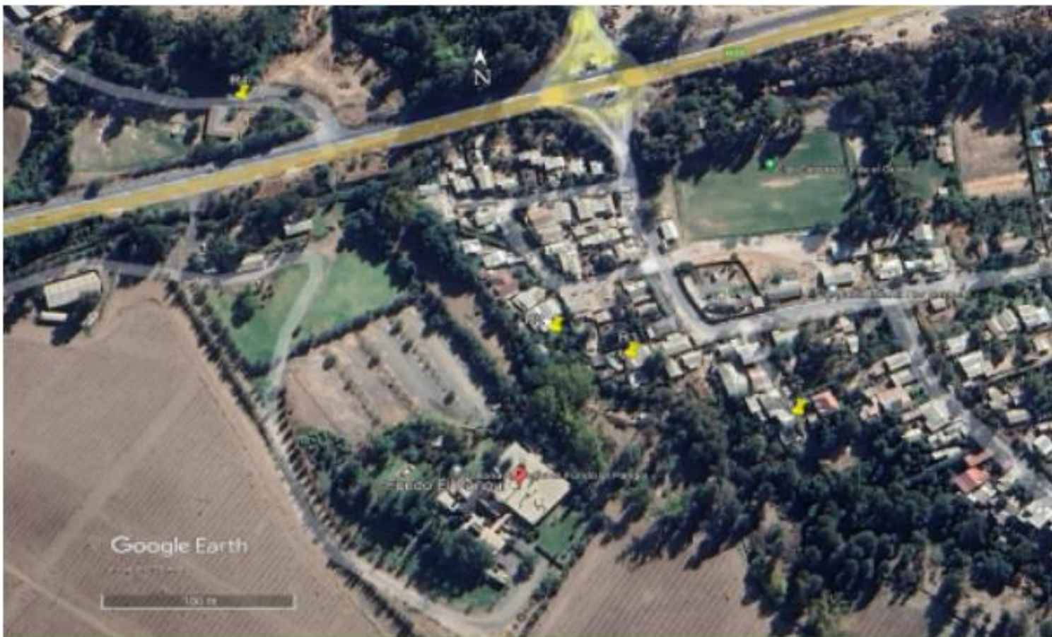
Imagen N°7: Ubicación de los receptores identificados y Unidad Fiscalizable