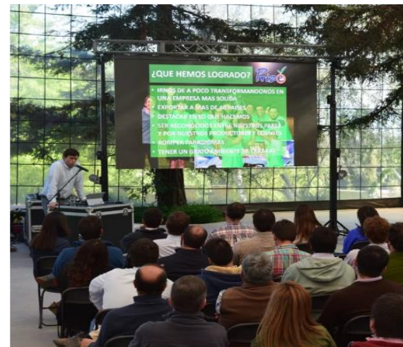
Imagen N°2: Salón de eventos arriendo a empresas

Fuentes: https://www.elpangui.cl/empresas