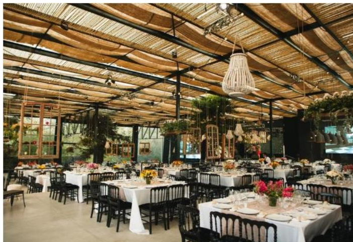
Imagen N°1: Salón de eventos Fundo el Pangui