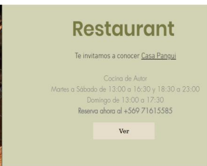
Imagen N°3: Horarios de funcionamiento de Restaurant