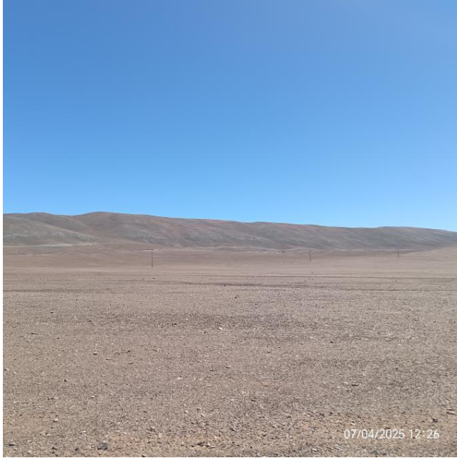
Figura 5.