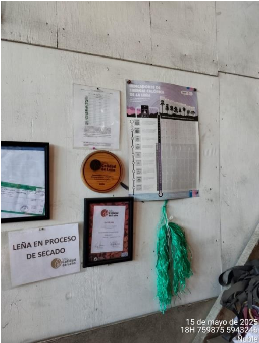
Fotografía 1: tabla de conversión de energía de la leña