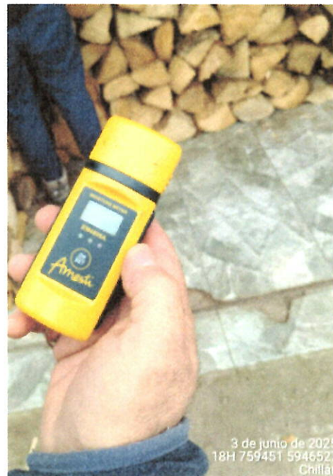
Fotografía 2: Xilohigrómetro