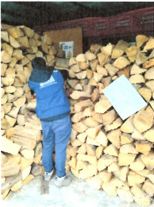
Fotografía 1: Leña para la venta