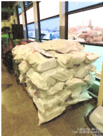
Fotografía 1: Punto de venta de leña