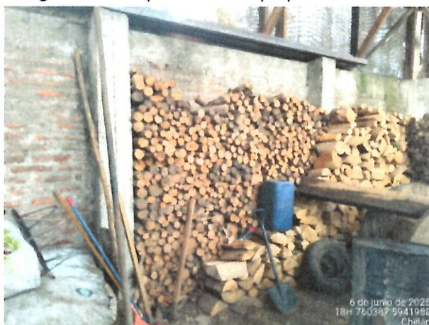
Fotografía 1: Leña para consumo propio

6 de junio de 2025 18h 760367 5941988 Chilán