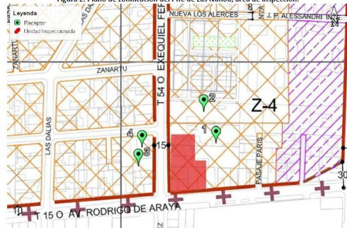
Figura 2. Plano de zonificación del PRC de Las Ñuñoa, área de inspección.