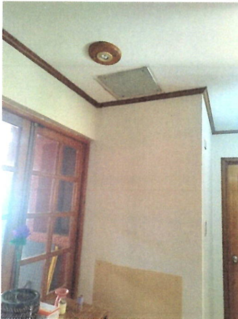
Fotografía 1: Área del equipo de calefacción a leña retirado.