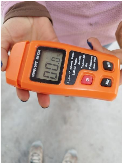
Fotografía 3: Xilohigrómetro