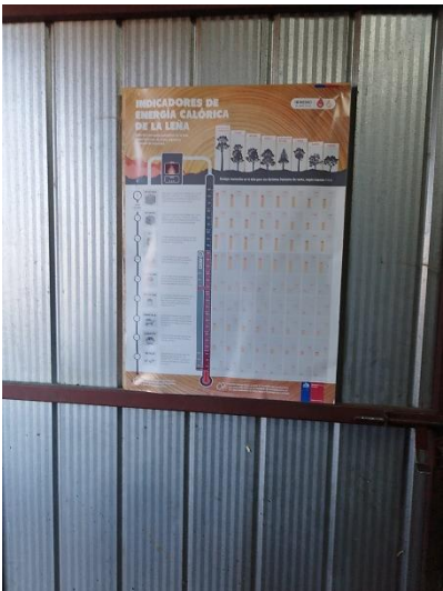
Fotografía 4: Tabla de Indicadores de Energía Calórica de la Leña