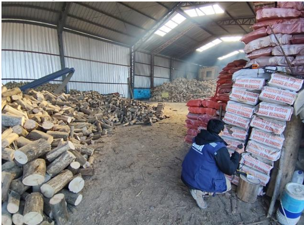
Fotografía 1: Leña disponible para la venta