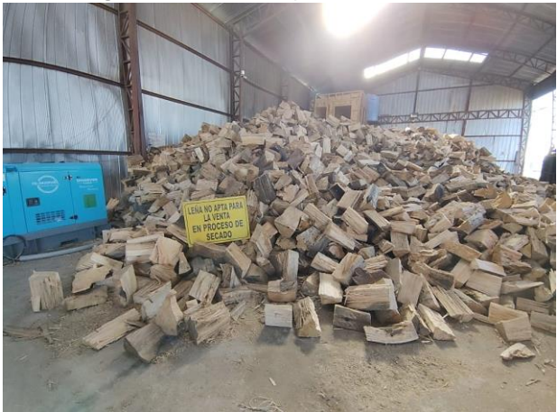
Fotografía 2: Leña en proceso de secado