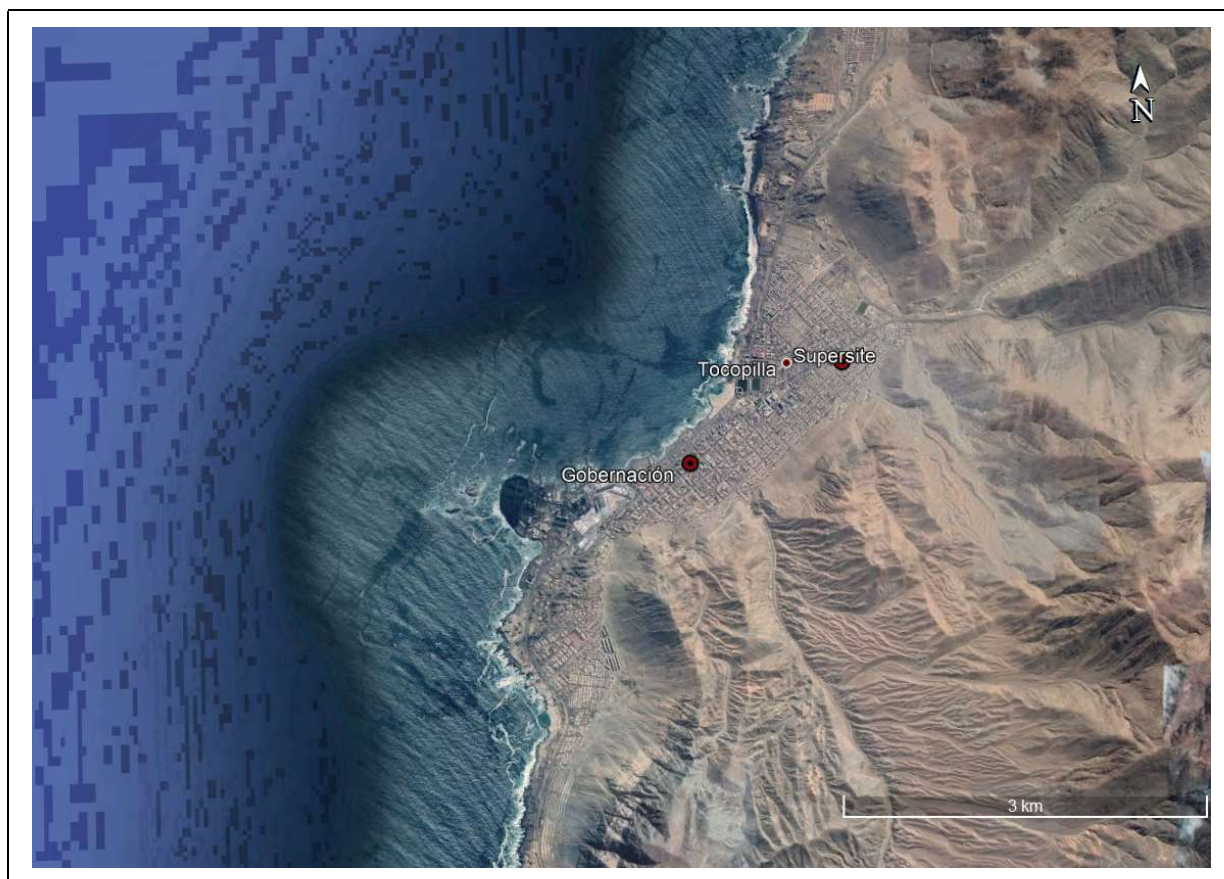
Figura 1 Ubicación de estaciones de calidad del aire de Tocopilla