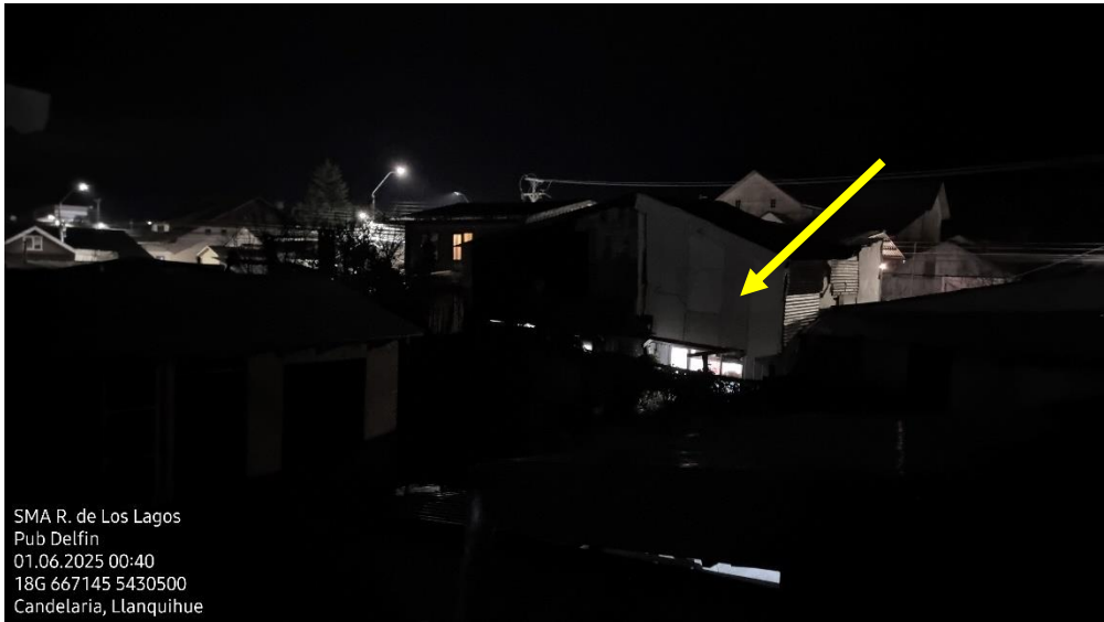
SMA R. de Los Lagos Pub Delfin 01.06.2025 00:40 18G 667145 5430500 Candelaria, Llanquihue