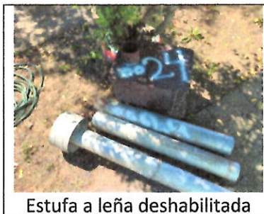
Estufa a leña deshabilitada