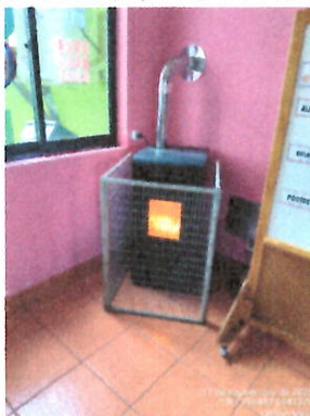
Fotografía 1: Equipo a pellet operando