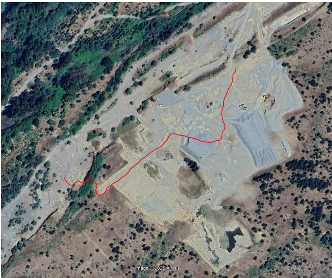
Imagen del recorrido realizado durante la inspección

Por otra parte, al solicitarse documentación respecto a permisos municipales y otros, el encargado indicó que no cuenta con documentos en el lugar.