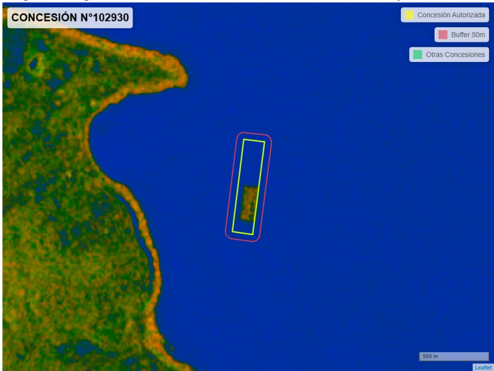
Figura 2. Imagen satelital del monitoreo realizado entre el 01/01/2025 y el 28/02/2025

En las siguientes figuras se muestran las imágenes analizadas para cada periodo y/o fecha: