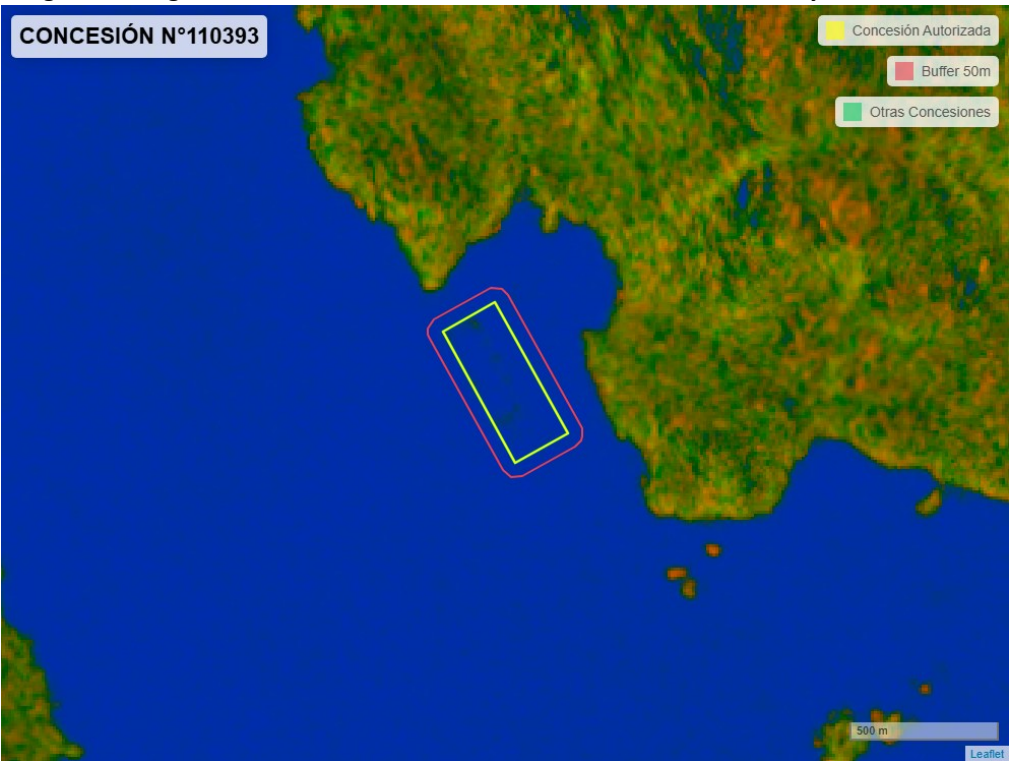
Figura 2. Imagen satelital del monitoreo realizado entre el 01/01/2025 y el 28/02/2025

En las siguientes figuras se muestran las imágenes analizadas para cada periodo y/o fecha: