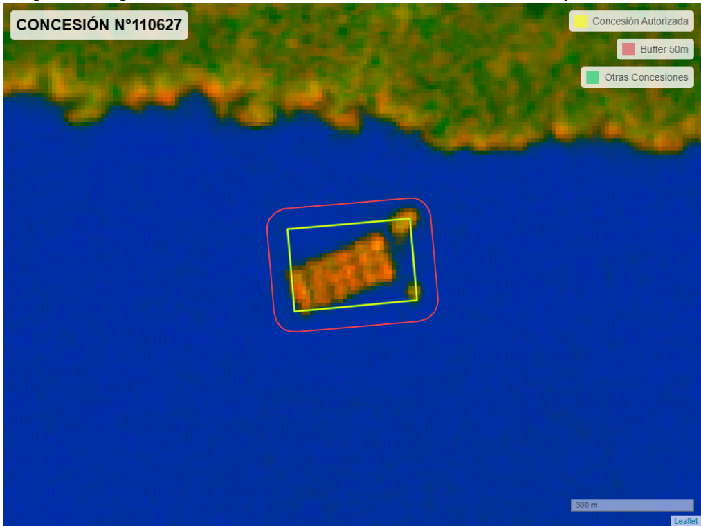
Figura 2. Imagen satelital del monitoreo realizado entre el 01/01/2025 y el 28/02/2025

En las siguientes figuras se muestran las imágenes analizadas para cada periodo y/o fecha: