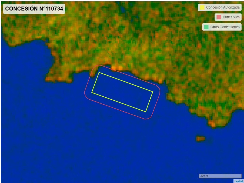
Figura 2. Imagen satelital del monitoreo realizado entre el 01/01/2025 y el 28/02/2025

En las siguientes figuras se muestran las imágenes analizadas para cada periodo y/o fecha: