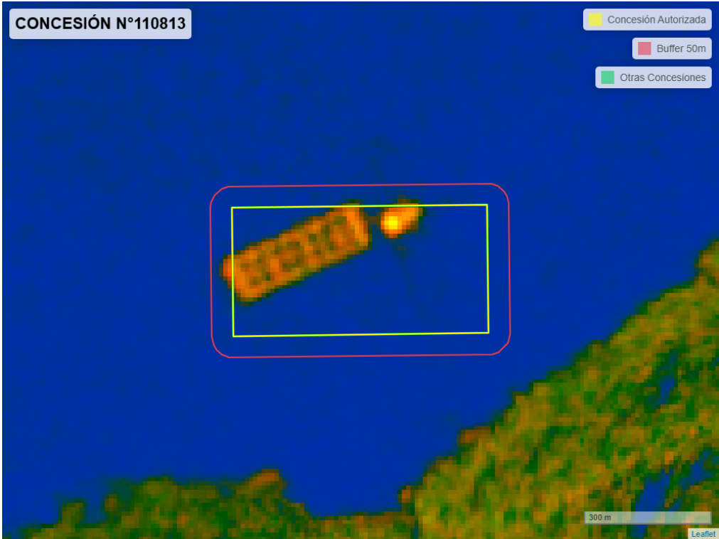
Figura 2. Imagen satelital del monitoreo realizado entre el 01/01/2025 y el 28/02/2025

En las siguientes figuras se muestran las imágenes analizadas para cada periodo y/o fecha: