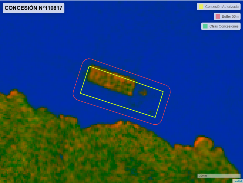
Figura 2. Imagen satelital del monitoreo realizado entre el 01/01/2025 y el 28/02/2025

En las siguientes figuras se muestran las imágenes analizadas para cada periodo y/o fecha: