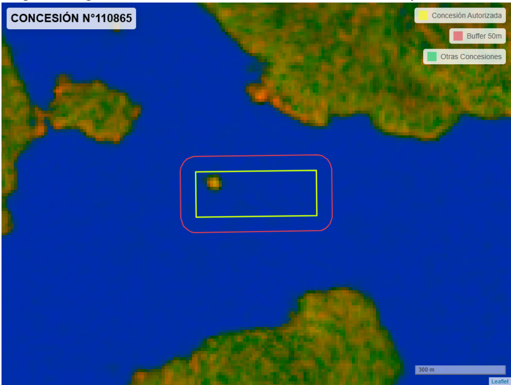
Figura 2. Imagen satelital del monitoreo realizado entre el 01/01/2025 y el 28/02/2025

En las siguientes figuras se muestran las imágenes analizadas para cada periodo y/o fecha: