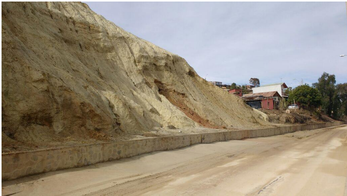
Relave las Catanas