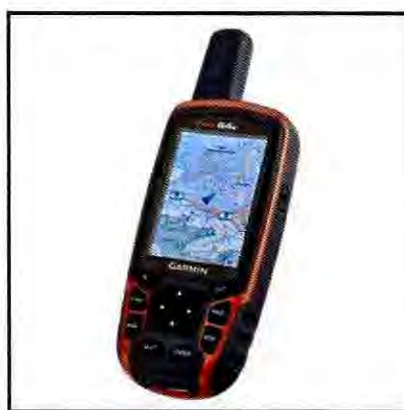
Figura 1. Equipo Garmin, Modelo GPSMAP 64s.

Dentro de las actividades a ejecutar, procedí a registrar los puntos geográficos de las estructuras inspeccionadas (georeferenciación), mediante equipo Garmin, Modelo GPSMAP 64s.