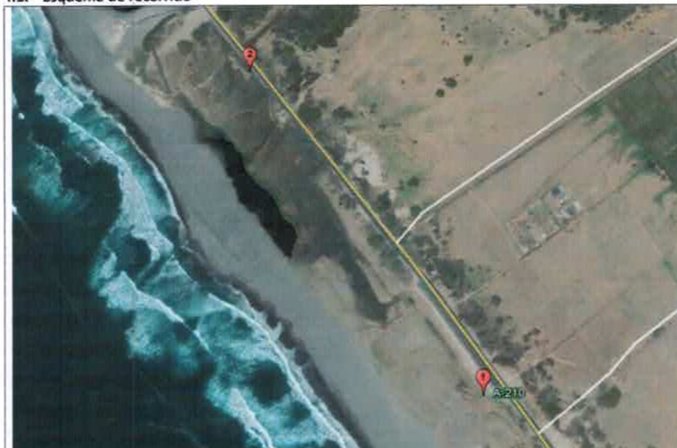
Figura 1. Esquema recorrido de Inspección