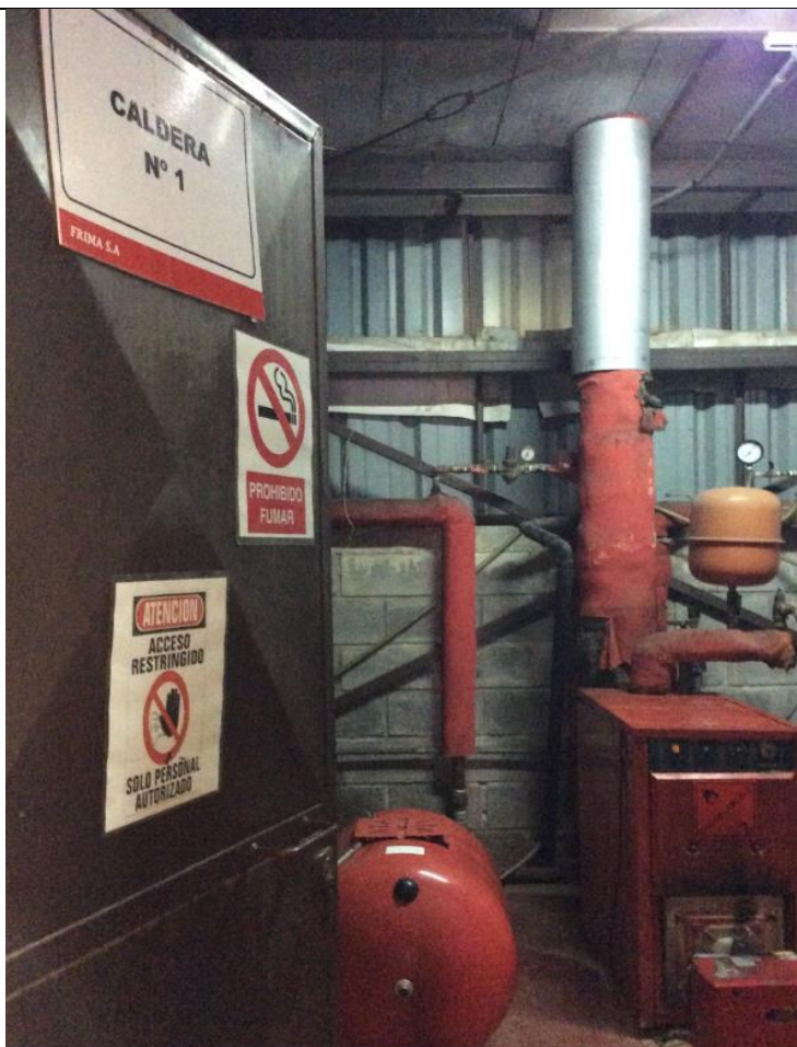
Fotografía N° 3