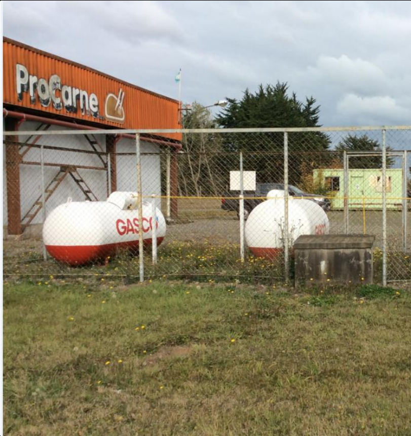
Fotografía N° 1