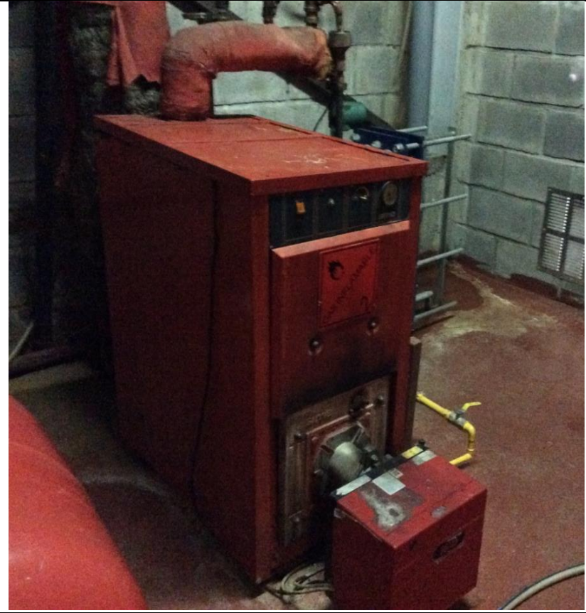
Fotografía N° 2

Descripción: Fotografía de las instalaciones de Procarne y su red de abastecimiento de gas para la caldera.