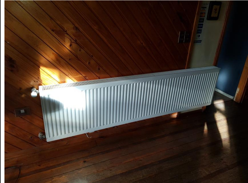
Fotografía N°3 Fecha: 29/07/2019 Fotografía de radiador de sistema de calefacción central