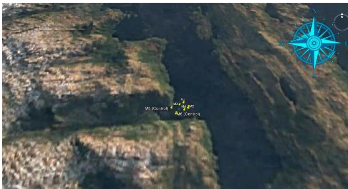
Figura 1: Ubicación de las estaciones de muestreo y medición.