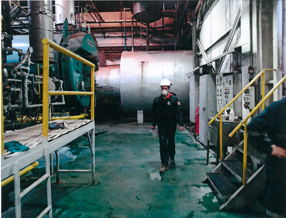
Imagen 2: Caldera N°5 al fondo de la sala de calderas.

Caldera N°1: la caldera se encontraba en funcionamiento al momento de la inspección, marca H. Briones y Cía, año 1988, N° de Registro SSSCON-16, no presenta el Informe Técnico Individual, y su placa no se encuentra actualizada.