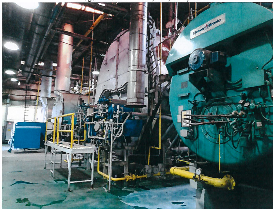
Imagen 1: Calderas N°1, N°2, N°3 y N°4

A continuación en la Imagen 1 y 2 se encuentra el registro fotográfico de las calderas: