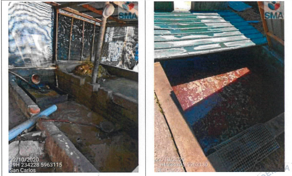
Foto 1 Cámara de recepción tratamiento primario de aguas verdes Foto 2 Cámara de recepción de aguas rojas