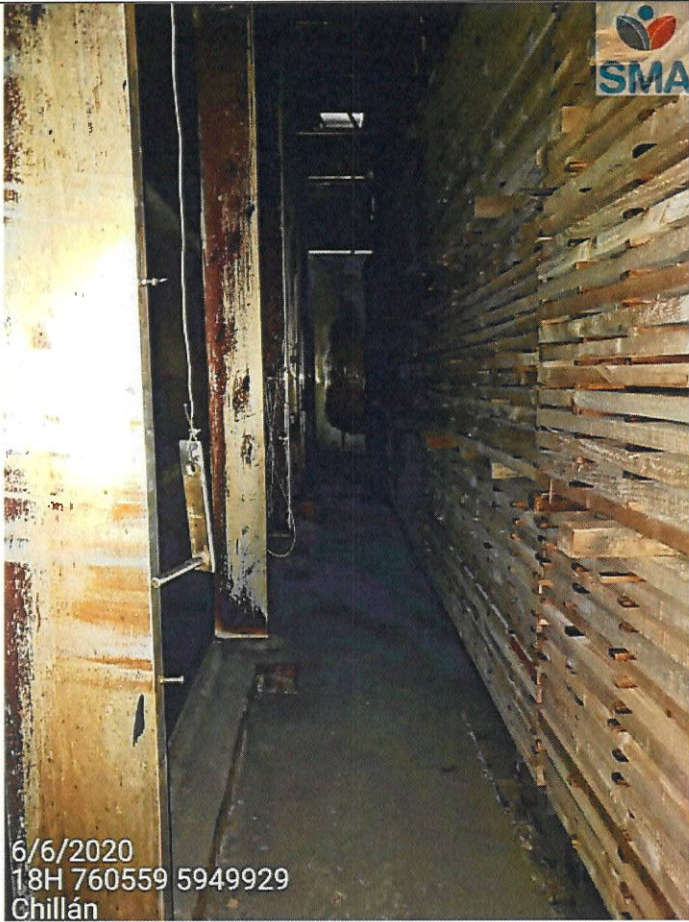
Cámara Secado N° 1 Cargada y sin funcionamiento.