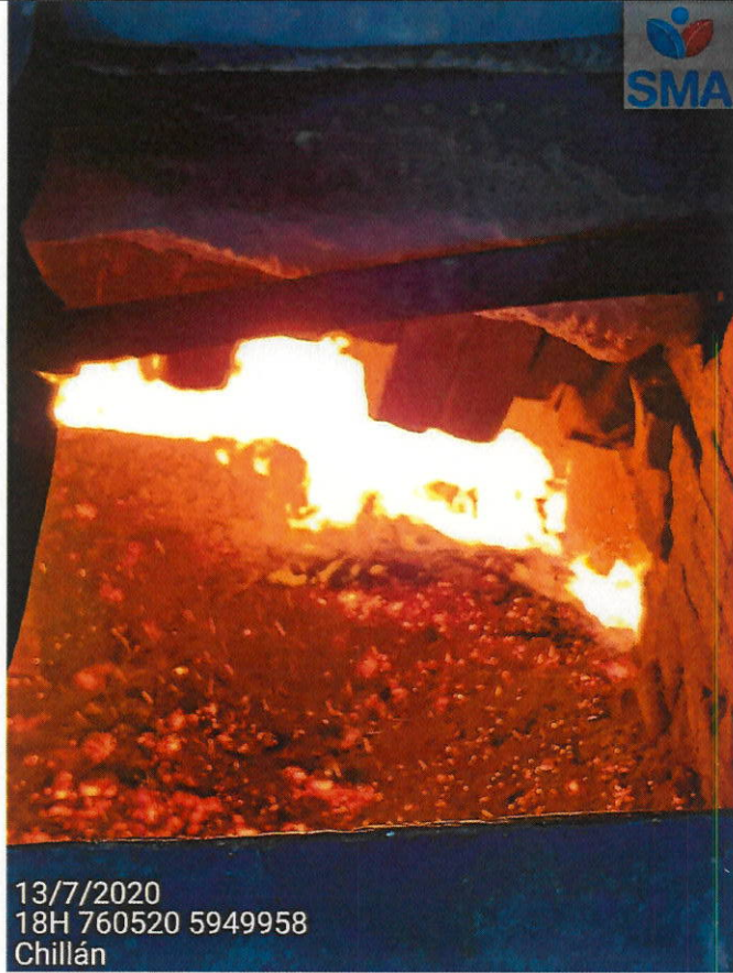
Caldera en operación.