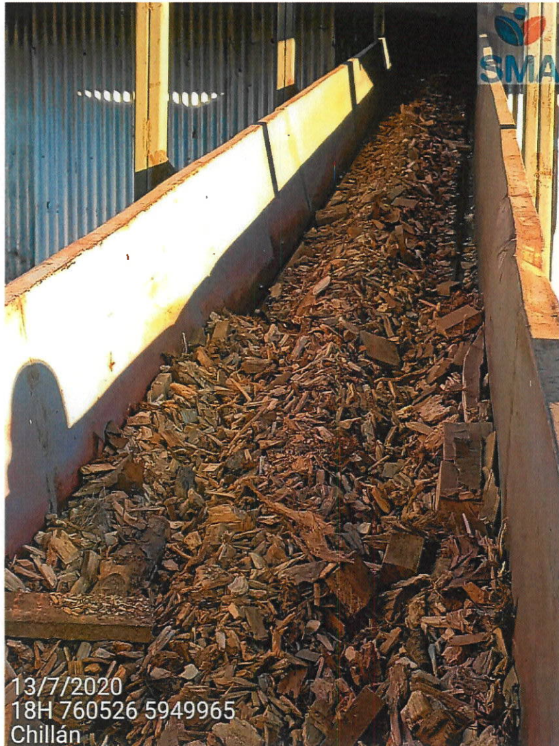
Correa alimentadora de combustible