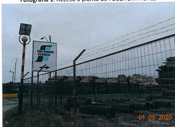
Fotografía 1. Acceso a planta de FULGHUM FIBRES