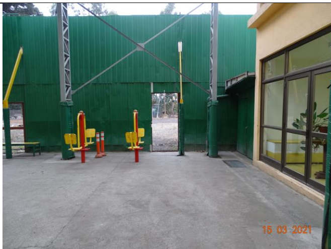
Fotografía 4. Acceso terreno desde Colegio Américo Vespucio.

Se tuvo a la vista el contrato de “Promeso de compra-venta y arrendamiento” entre la Sociedad de ingeniería y Construcción Ltda., y sociedad educacional Hernández Cantero SpA, del 01 de octubre de 2018, en donde la primera arrienda el sitio ubicado en calle dos oriente población Leonardo Moreno de la ciudad de Coronel, a la segunda.