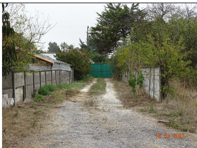
Fotografía 2. Portón Acceso calle Dos Oriente (vista interior)