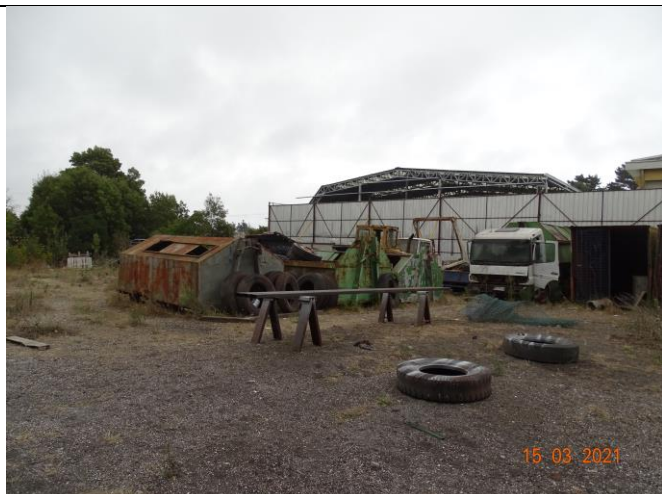
Fotografía 3. Instalaciones Base de Operaciones SOCOIN (sin operación)