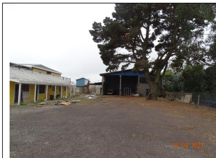
Fotografía 1. Instalaciones Base de Operaciones SOCOIN sin operación

La Sr. Canteros indica que el colegio, una vez arrendado el sitio, gestionó el retiro de residuos y basuras del lugar, extrayendo entre 60 a 70 camionadas de basura en el proceso de limpieza. Indica también que el colegio costó la aplicación de ripio en el suelo, y que solo ellos ahora tienen acceso al lugar.