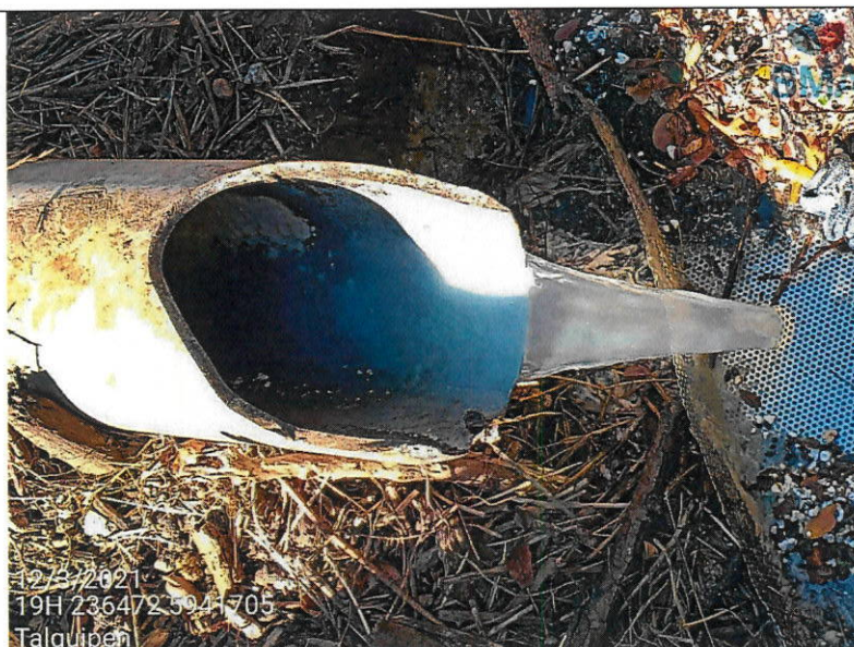
Foto 5: Tubería del ducto efluente de 20 cm de diámetro con descarga en desarrollo, caudal estimado alrededor de 0,5 l/segundo