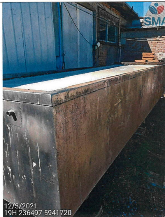
Foto 4: de tina exterior llena de material resultante de proceso.