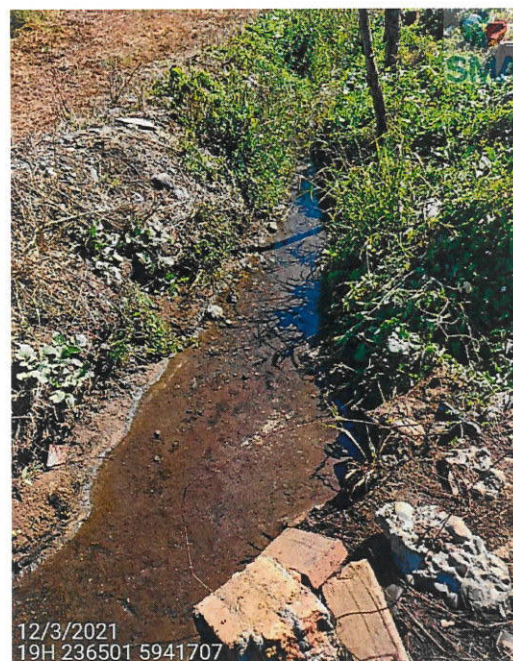
Foto 7: Aguas arriba inmediatamente antes del ducto efluente, sin alteraciones de color u olor.