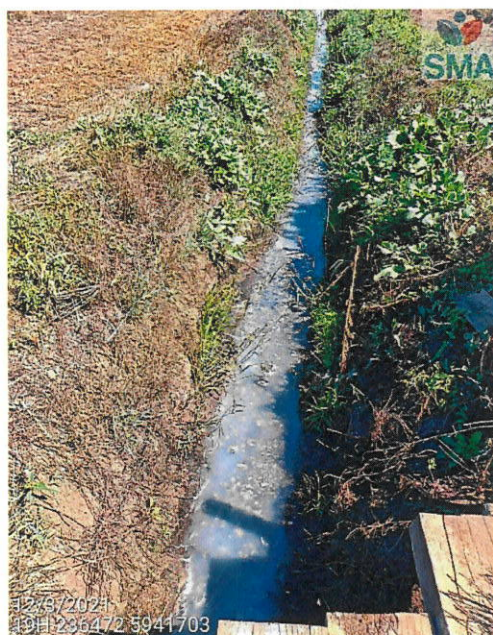
Foto 6: Canal receptor de la descarga, aguas abajo inmediatamente después del ducto efluente con alteraciones en color u olor.