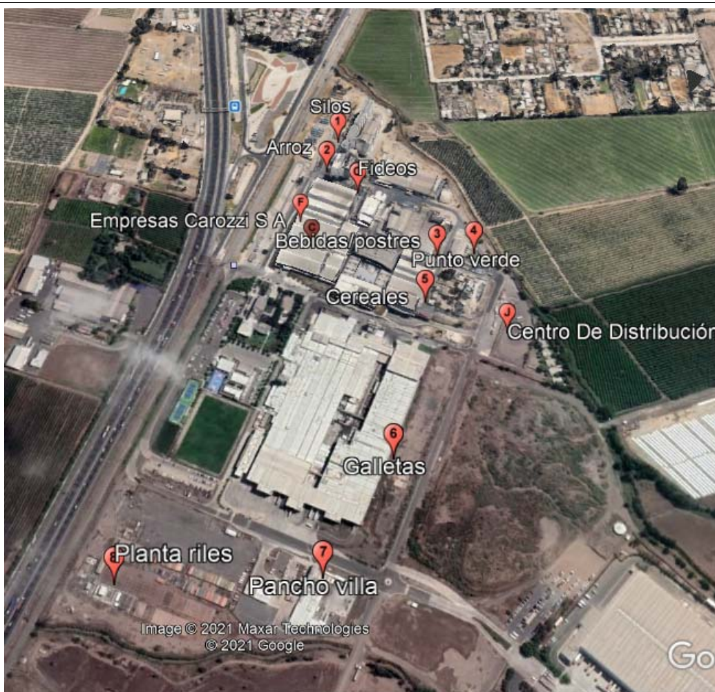
Figura con los puntos del recorrido.

Al finalizar la inspección ambiental en la Planta de Carozzi S.A. de Nos, se recorre la zona aledaña a la planta circulando a medio día por las direcciones del sector de los denunciantes, como calle Los Morros de San Bernardo, donde se percibe olor a galleta en el ambiente. El viento a medio día del día de la inspección, marcaba una velocidad 8,9 kph y una dirección de 322,681° (estación quinta normal).