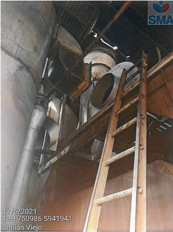
Desconexión de línea de abatimiento de caldera