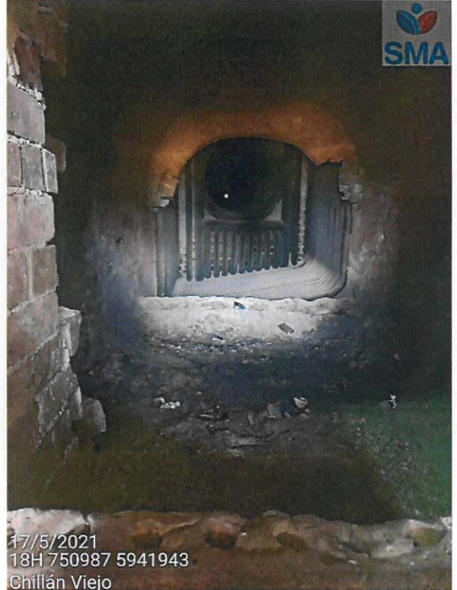
Ausencia de combustible en hogar