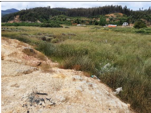
Fotografía 2. Área colindante entre sitios y Estero El Molina, sin intervención.