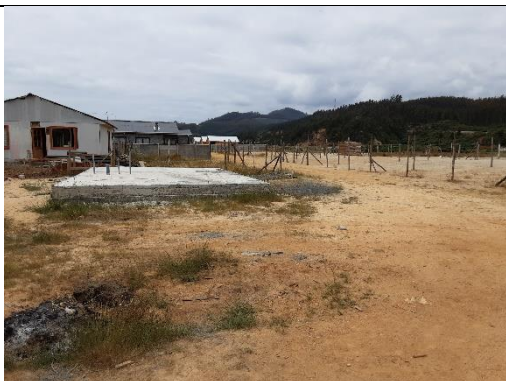
Fotografía 1. Loteo de sitios RCA N°36/2001

En el lugar, no se evidenciaron maquinarias o instalación de faenas. Los sitios se ubicaban colindantes al Estero Los Molinos, sin evidenciarse intervención en éste.