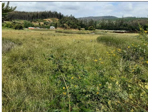
Fotografía 4. Estero El Molina, sin intervención.