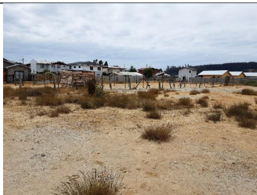
Fotografía 3. Loteo de sitios RCA N°36/2001