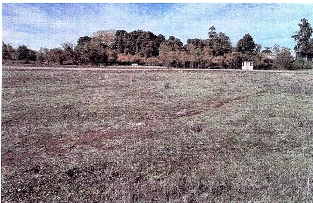
Fotografía N°2: Vista del sector del proyecto Riberas del Renaico.

Para cualquier consulta relativa a lo requerido, favor comunicarse con el Sr. Marcelo Araya al fono (41) 285 2266 o al correo electrónico marcelo.araya.o@mop.gov.cl .