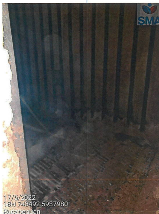
Foto 4 Chimenea sin operación