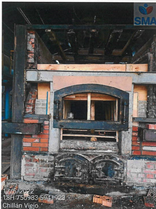
Reparación de hogar de caldera