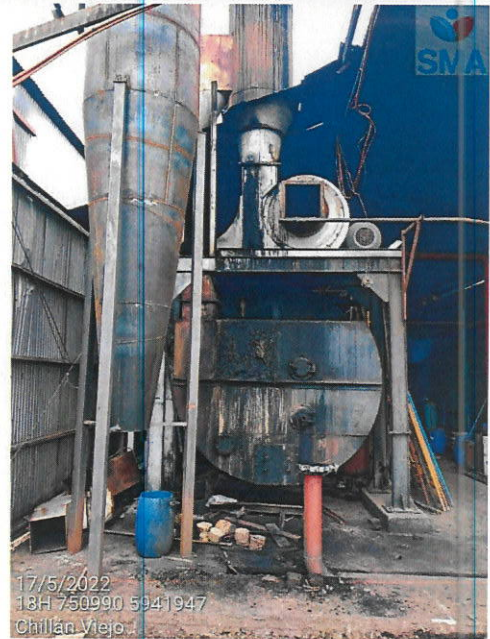
Caldera con unidades de abatimiento desmontadas