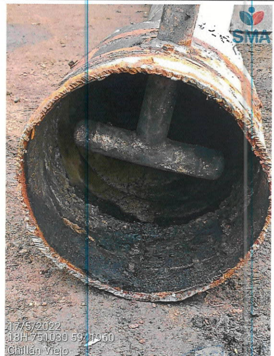
Trabajos de ensamblaje