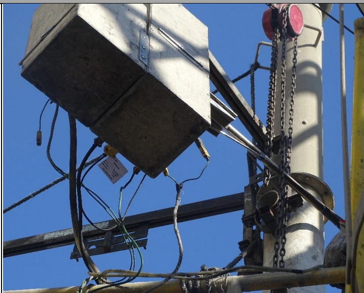
Fotografía N°2: Actividad de inspección 06-06-2022. Ducto fuente tipo proceso PR-11999.