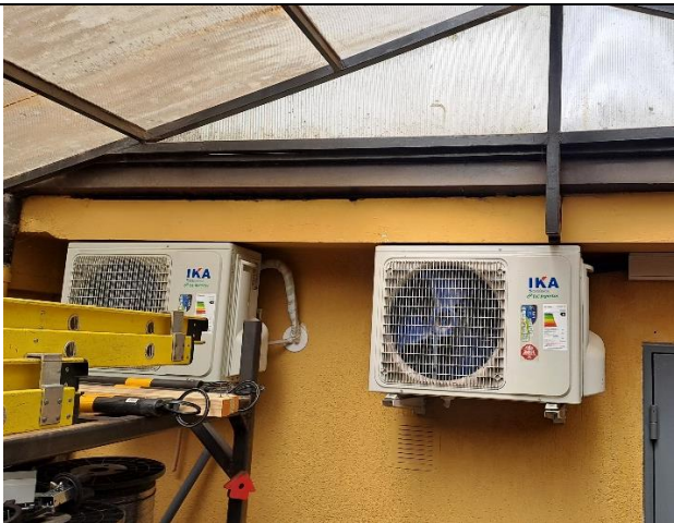
Fotografía 2. Ventiladores ubicados en el sector trasero, destinado como bodega.

Debido a que no se realizaron las mediciones, se finaliza la inspección a las 11:40 horas.