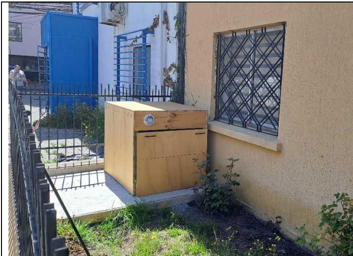
Fotografía 1. Grupo electrógeno de la empresa, ubicado en el jardín delantero.

Adicionalmente, se constató la existencia dos equipos extractores de aire, los cuales se ubican el patio trasero en la bodega de la empresa, estos se encontraban en funcionamiento al momento de la inspección, no obstante, el ruido no fue percibido desde la vivienda receptora.