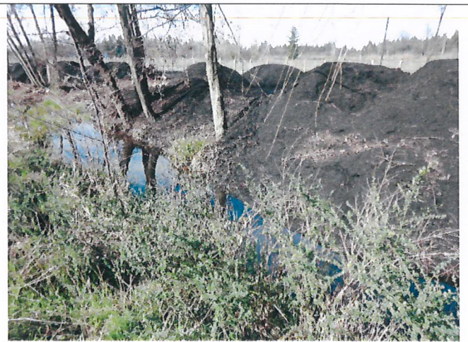
Fotografía 2. Acopio cenizas sitio 1- vista hacia la ruta