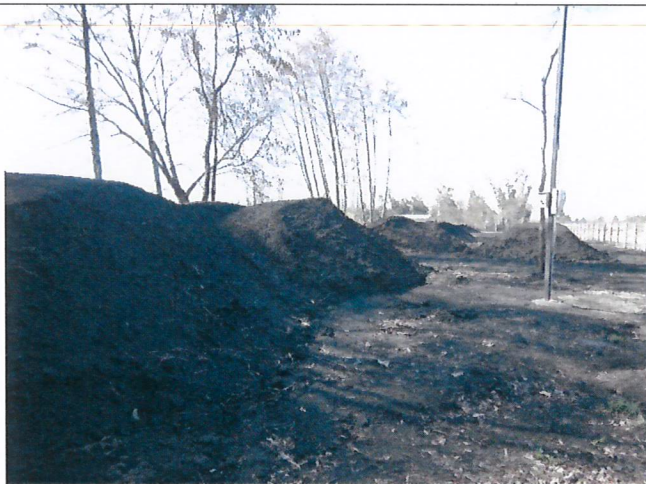
Fotografía 1. Acopio cenizas sitio 1- vista desde la ruta

En el lugar se observa un poste, aparentemente recién instalado, en el cual se observa que la capa de cenizas ya compactada posee entre 50 y 60 cm de profundidad.