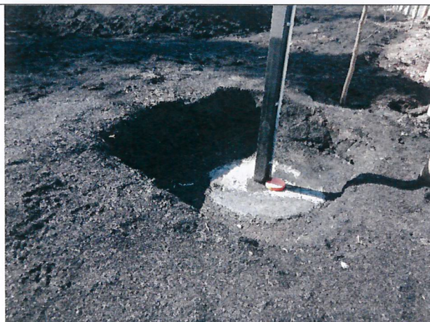
Fotografía 3. Acopio cenizas sitio 1- vista profundidad capa compactada