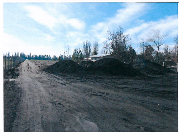
Fotografía 4. Acopio cenizas sitio 2- vista desde la ruta