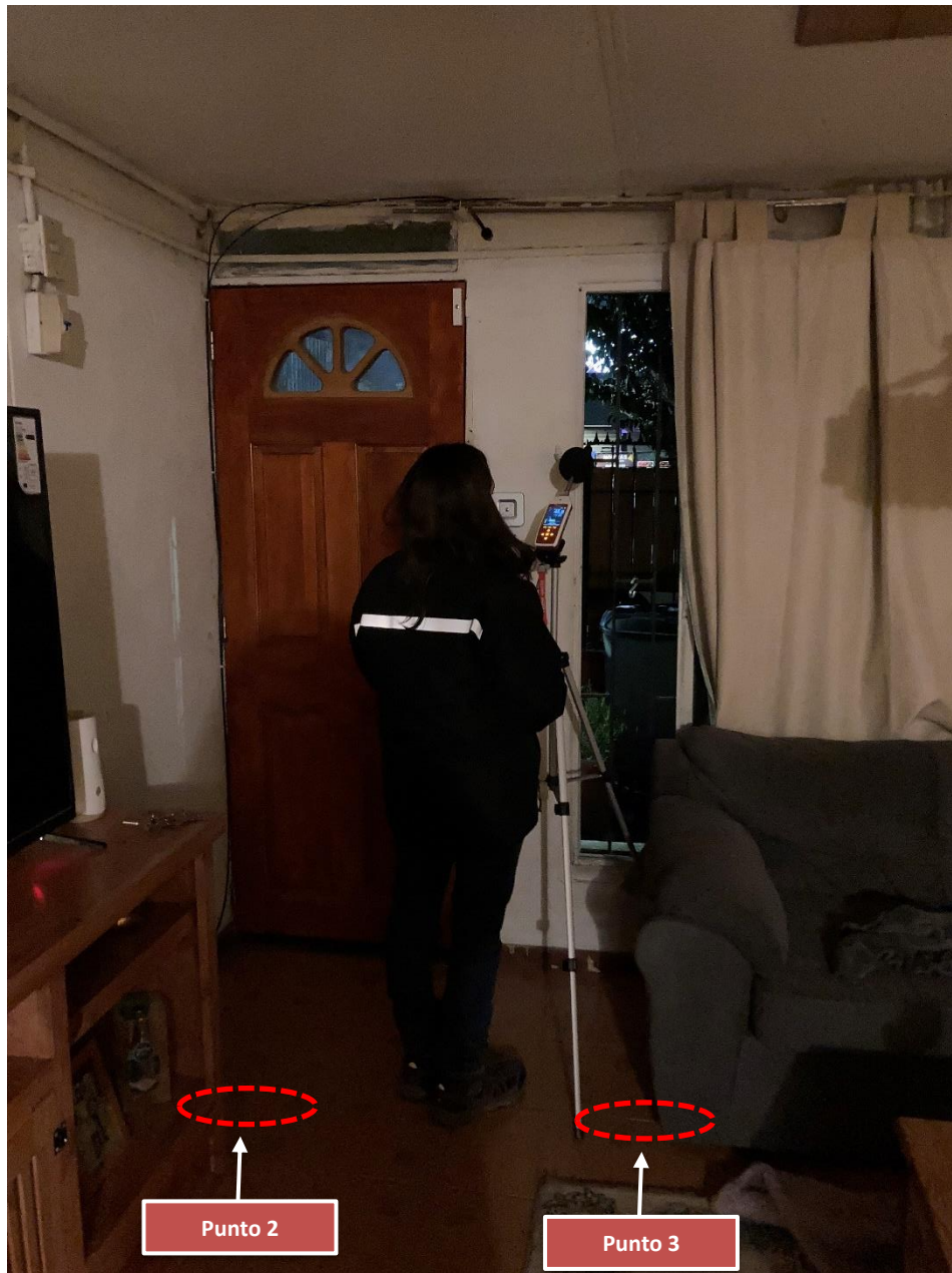
Fotografía 2. Fecha: 01-07-2023

Descripción Medio de Prueba: Punto 1 de la medición interna en living de la vivienda del receptor "2"