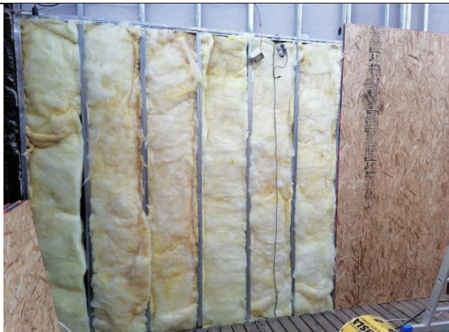
Fotografía 4.

Descripción del medio de prueba: Placas de madera acopladas una al lado de la otra en la estructura metálica.