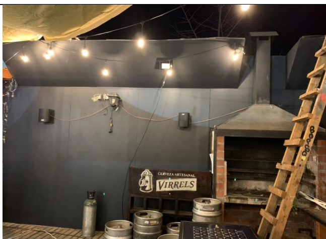
Fotografía 6.

Descripción del medio de prueba: Vista del material blanco tipo "lanilla" adosada en la estructura y la construcción de la corona del muro en inclinación hacia el interior del local.