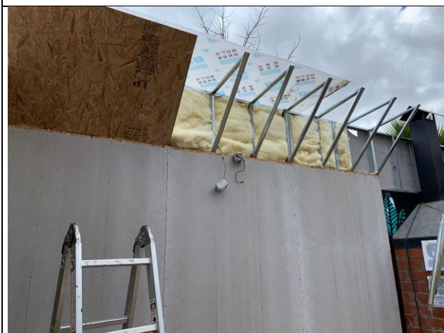
Fotografía 5.

Descripción del medio de prueba: Material blanco tipo "lanilla" adosado en la estructura metálica.