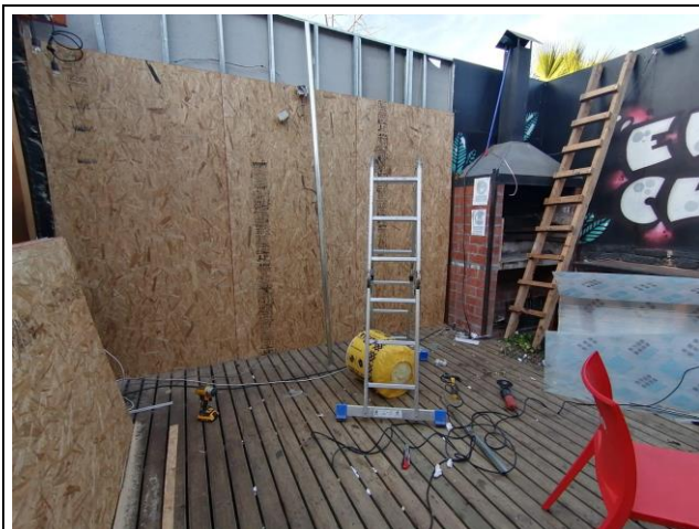
Fotografía 3.

Descripción del medio de prueba: Placas de madera acopladas una al lado de la otra en la estructura metálica.